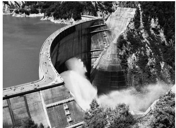
図-1 黒部ダム（富山県）

みなさんはアーチを知っていますか？ アーチの不思議な力は、古くから身のまわりに使われています。とくに大きな力が欠かせない土木構造物でよく見ることができます。例えば、図-1に示した巨大な黒部ダムは、見た目も良くて観光スポットにもなっています。それから大きな構造物をつくる時には建設機械の力が欠かせません。そこで、実際に組積造のアーチを組み立てたり、アーチ式ダムを作ったり、建設機械のラジコンを操作したりして、身のまわりの『土木の技術』を体験してみましよう。