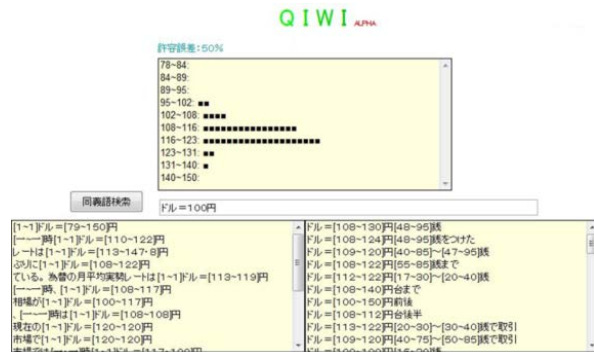
図3:テキスト中の数値表現マイニングシステム