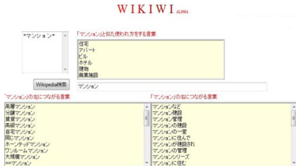
図2:テキストマイニングによる検索支援システム