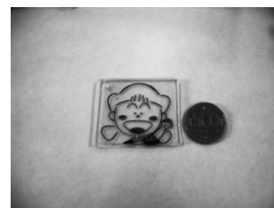
加熱後のプラバン