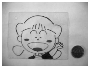
加熱前のプラバン