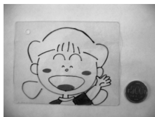
加熱前のプラバン