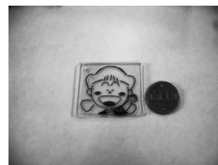
加熱後のプラバン