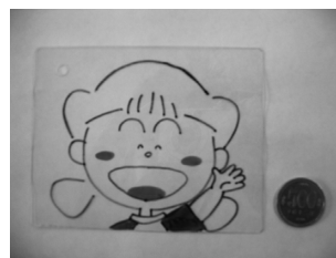
加熱前のプラバン