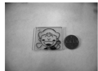
加熱後のプラバン