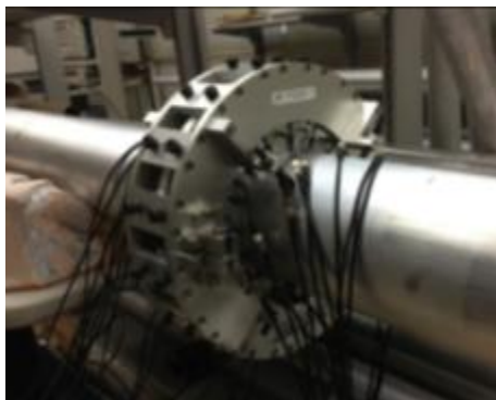
FIG. 2 配管検査用圧電式ガイド波センサー (世界標準方式2種類を国内で唯一保持している)