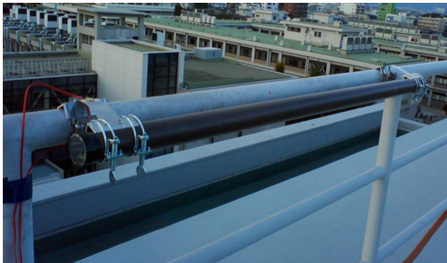
図2 建物屋上の落下防止柵背後に設置した円柱のウェイクエクサイテーションとその風力発電の可能性の検討例