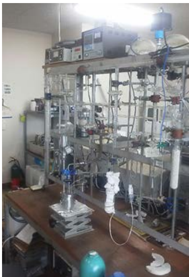
Fig. 1 水蒸気の吸脱着速度を自動測定可能な定容型吸着量測定装置..