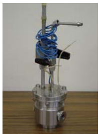
Fig. 2 専用IRセル