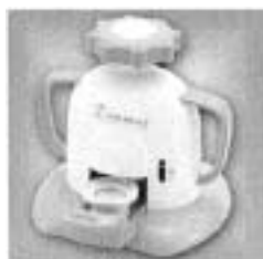
Can バッチ good！ハローキティ(バンダイ) (C)1976, 2002 SANRIO CO.,LTD.