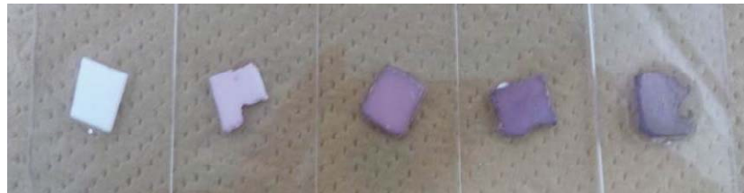
図2 プラズモニクス-フォトニック結晶ハイブリッドによる強力な電場増強効果を起こさせるためナノ構造作製のために、金ナノ粒子分散液にゲル固定化コロイド結晶を浸漬させたもの。左から、浸漬時間0時間、1時間、6時間、12時間、24時間。[Mori et al., ICMP2014, abstract accepted]